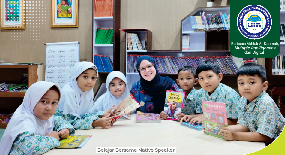
Belajar Bersama Native Speaker