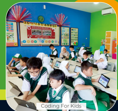
Coding For Kids