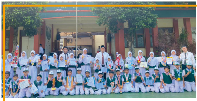
BERKARAKTER, DIGITAL, PARA BINTANG

Menjadi lembaga pendidikan terkemuka dalam pembinaan keislaman, keilmuan, dan keindonesiaan, dengan